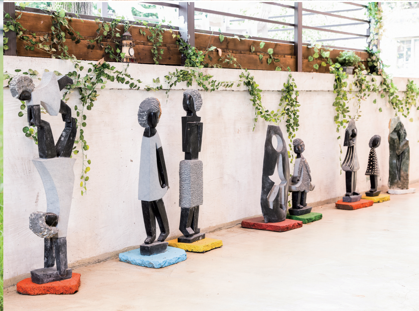
들려주고 싶은 이야기 쇼나조각과 함께하는 나의 정원은 귀 기울일 수 있는 힐링공간이 됩니다.