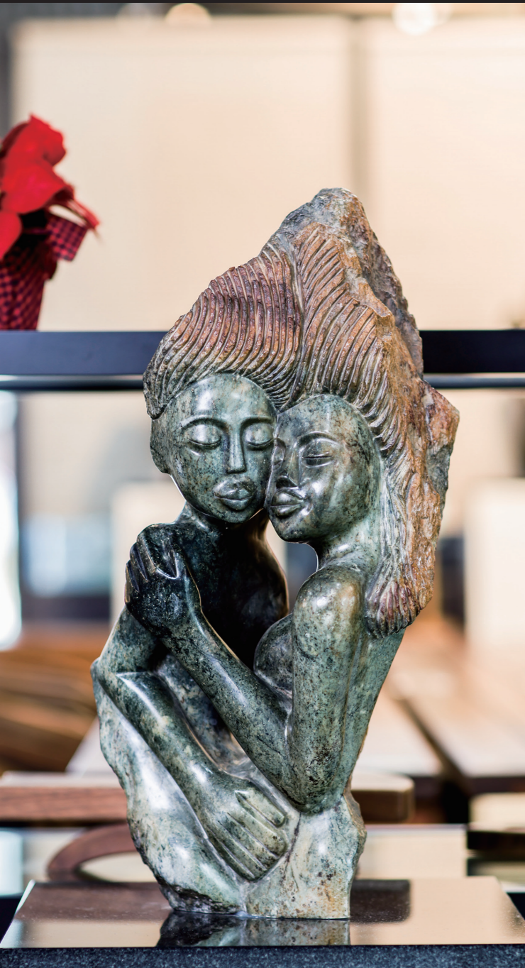
TRUE LOVERS / 59*32 / OPAL STONE