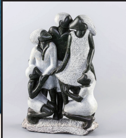
26*16 / OPAL STONE