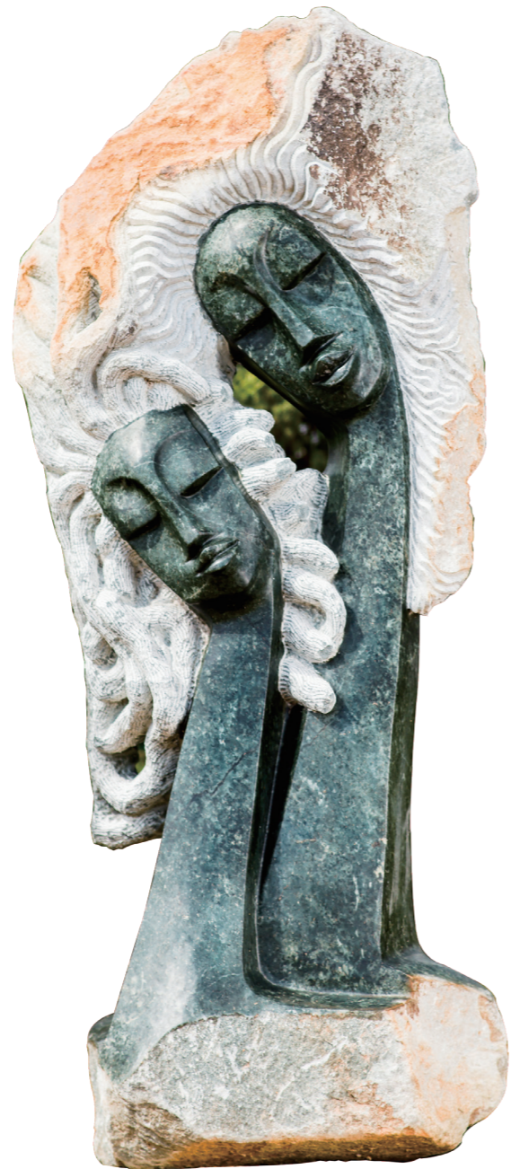
LOVERS / 125*51 / OPAL STONE