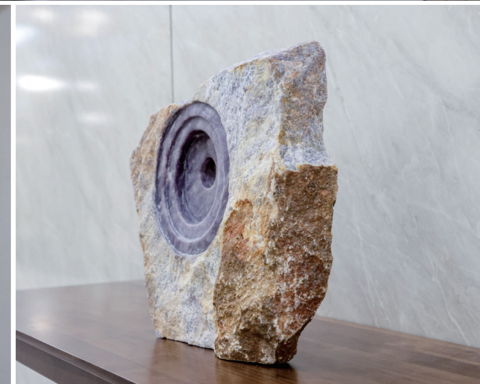
공간의 아름다운 진화 쇼나조각과 함께하는 나만의 갤러리