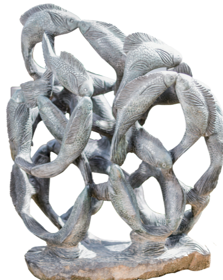
FISH DANCE / 125*105 / OPAL STONE