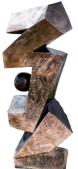
PATIENCE / 155*58 / SERPENTINE