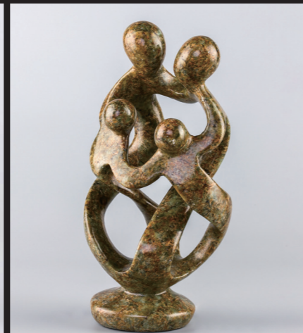
33*17 / SOAP STONE