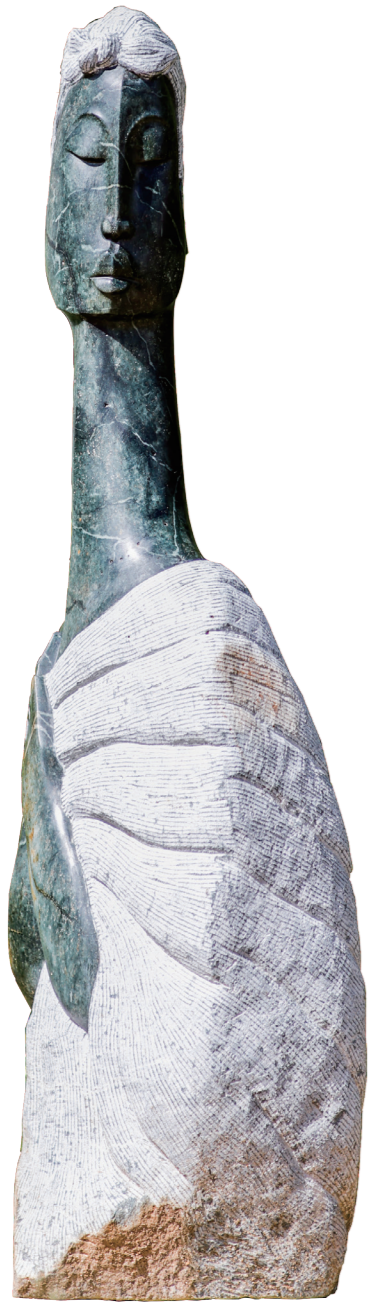
WOMAN / 99*37 / OPAL STONE