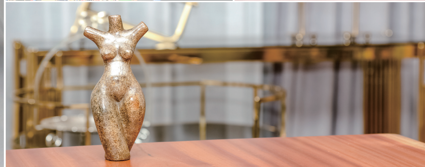
인테리어의 완성 쇼나조각으로 빛나는 공간 행복한 미소