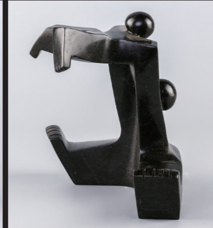
21*23 / SPRING STONE