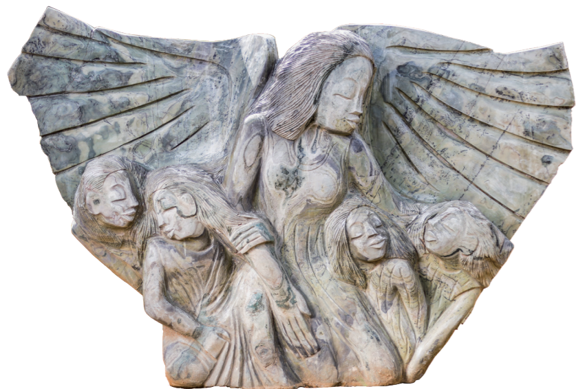
ANGEL / 90*140 / BUTTER JADE