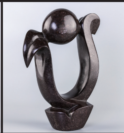
32*23 / COBALT STONE