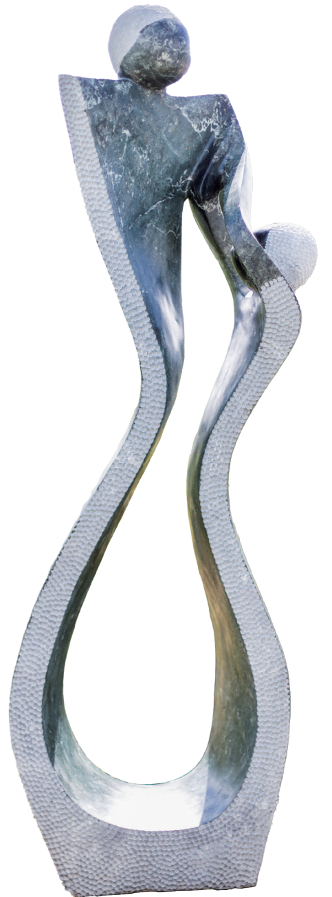
PLAYING / 151*48 / OPAL STONE