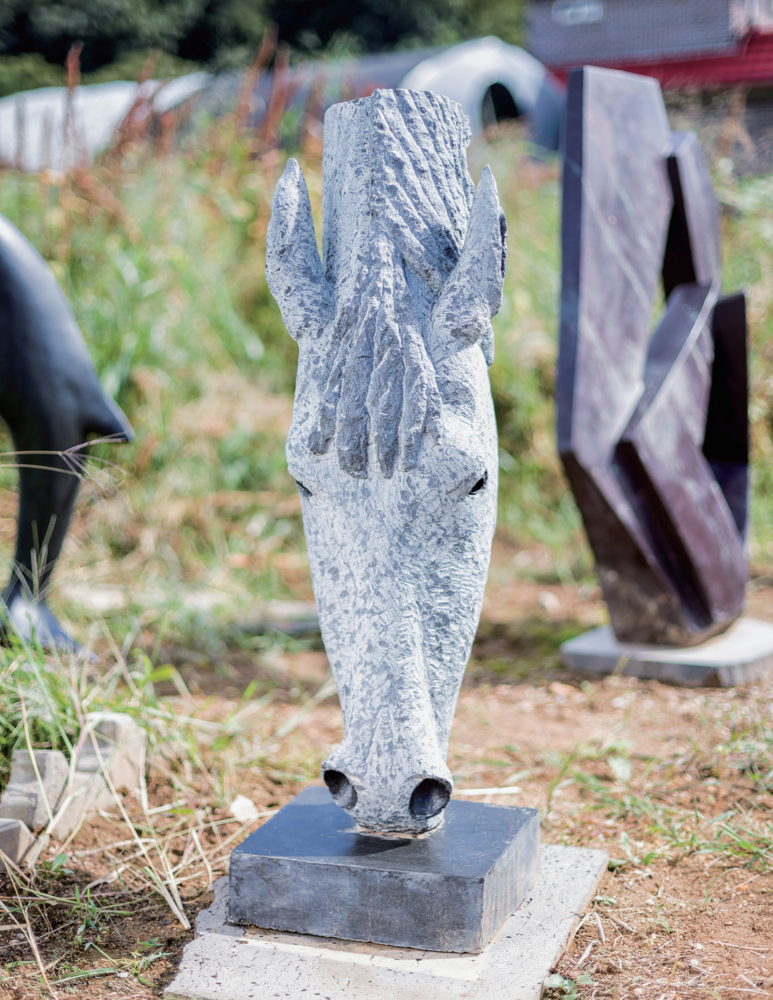
MEANINGFUL GIFT 의미있는 선물 | 동물작품