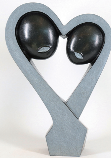
HEARTS LOVERS / 37*26 / SPRING STONE