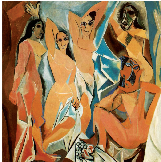
피카소 아비뇰의 처녀들