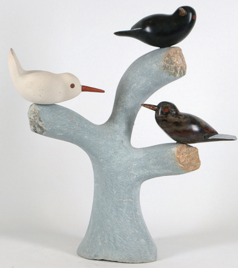
SONG OF BIRDS / 41*36 / SOAP STONE