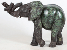
장수 행운 품요 코끼리