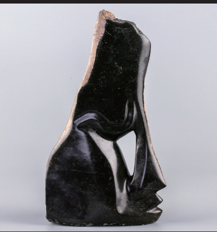
28*16 / SPRING STONE