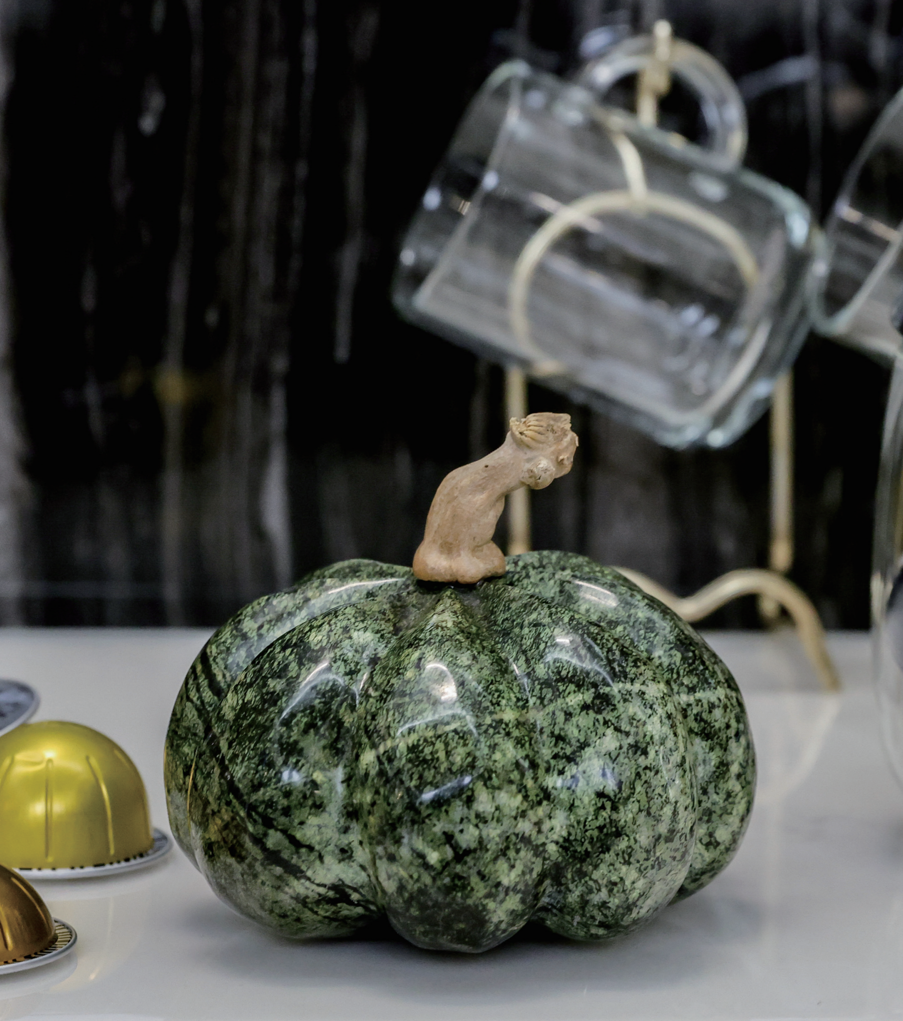
MODERN HOMETERIOR 모던 홈테리어 | 소형작품