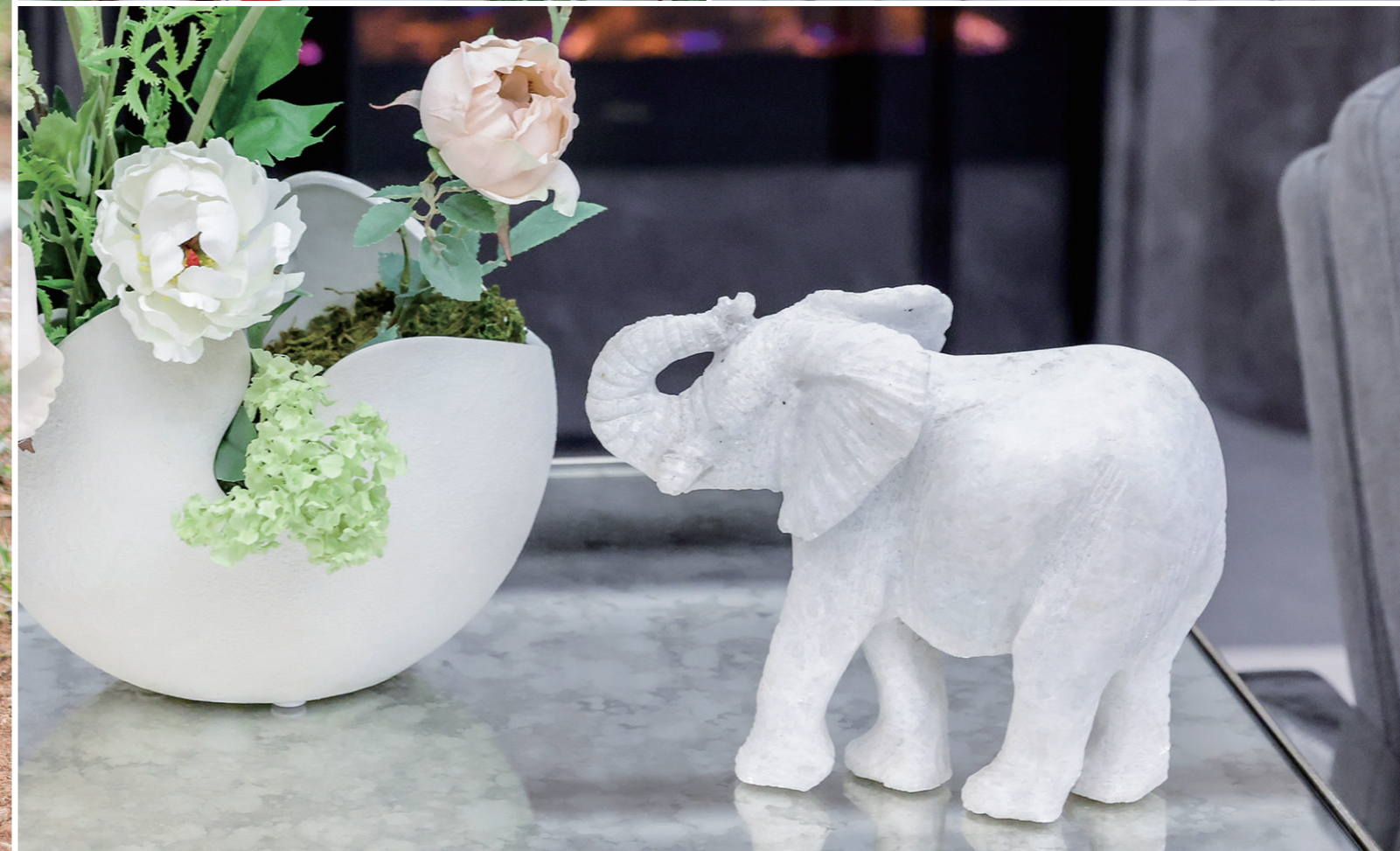
의미를 담아 건네면 나는 당신을 당신은 나를 특별하게 기억합니다.