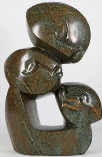
HAPPY FAMILY / 38*25 / SERPENTINE