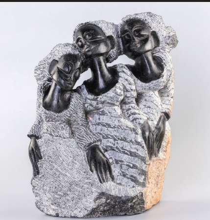
33*26 / SPRING STONE