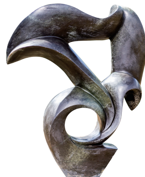
FLYING UP / 108*97 / COBALSTONE