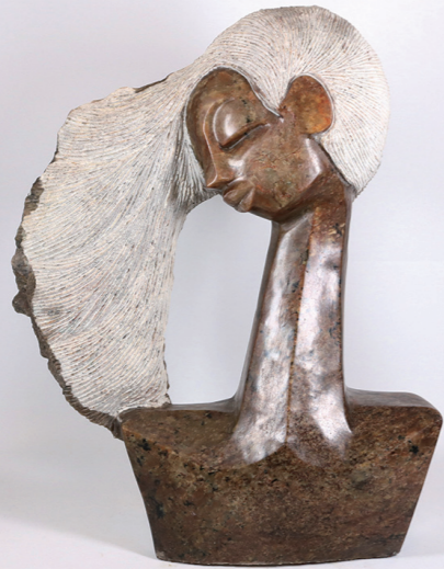
MODEL / 68*50 / OPAL STONE