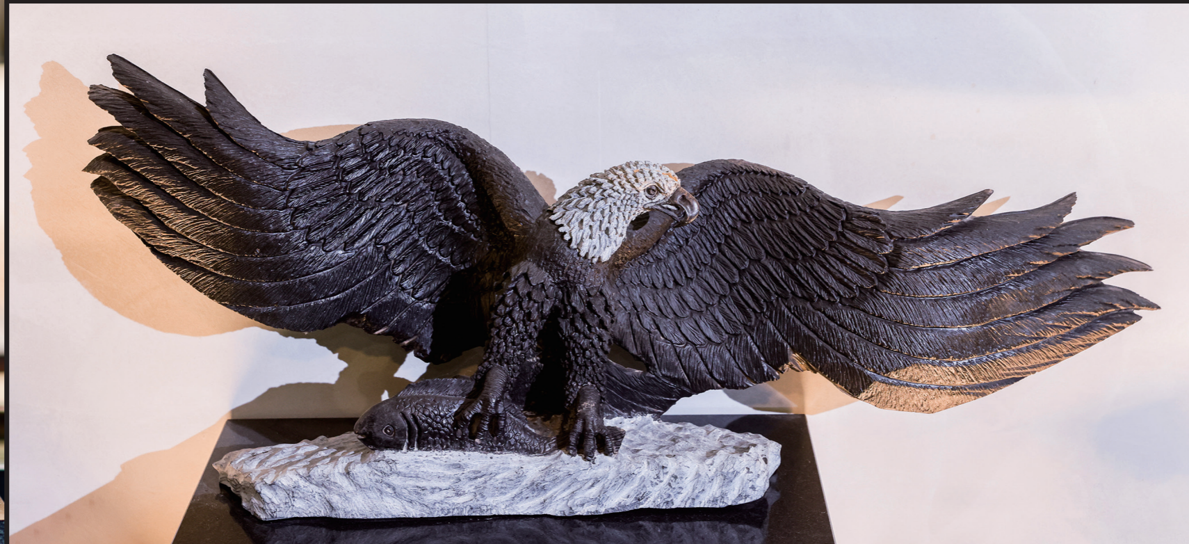
FLYING EAGLE / 34*100 / SPRING STONE