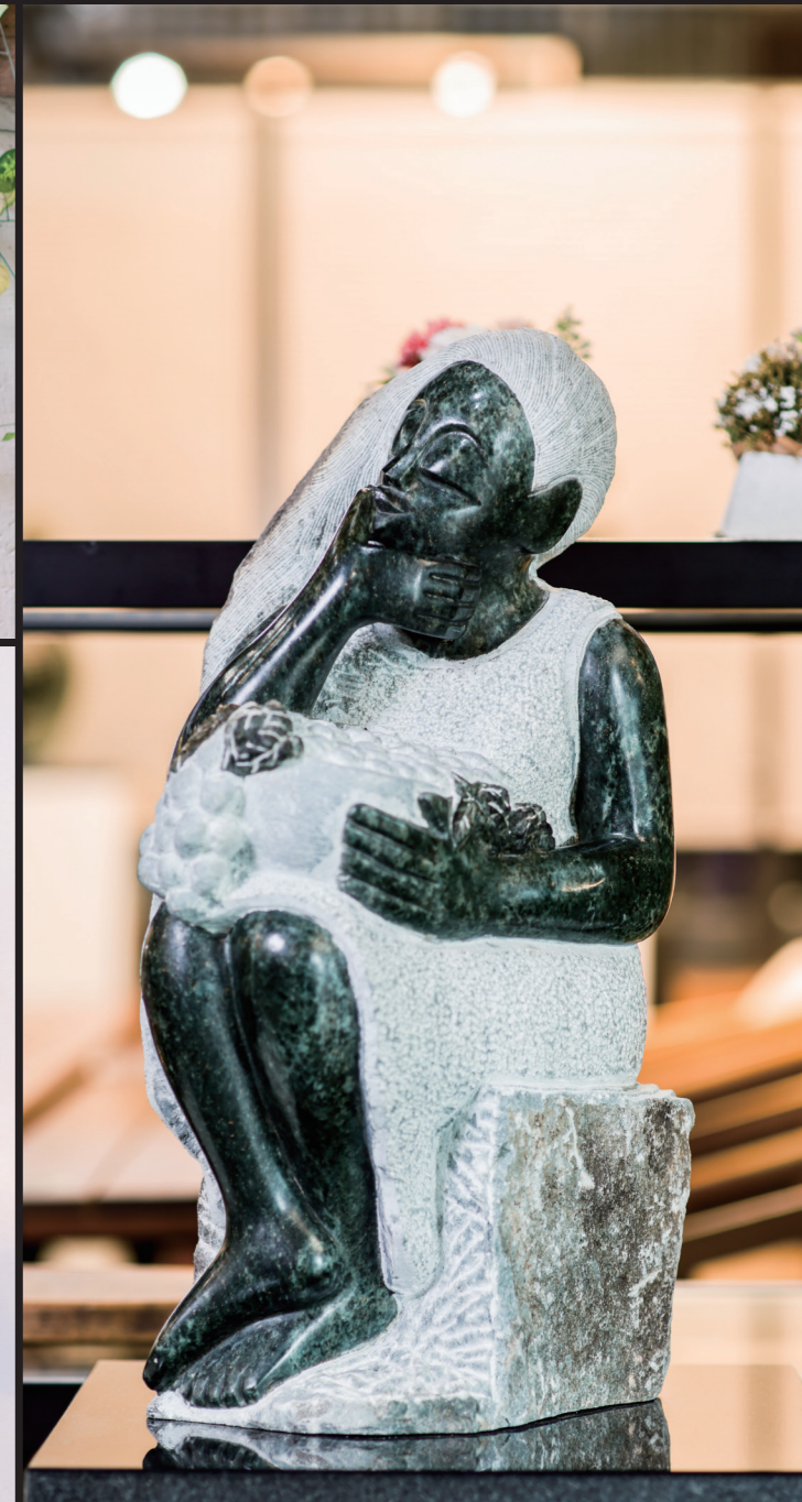
WOMAN / 55*30 / OPAL STONE