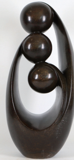
HAPPY FAMILY / 46*20 / SERPENTINE