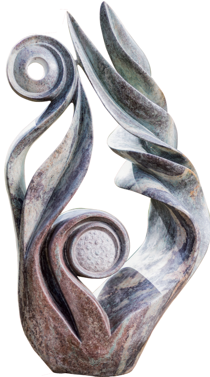
FLOWER / 101*60 / COBALT STONE