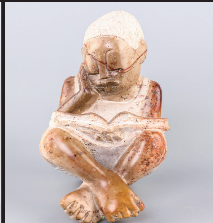
19*13 / WHITE OPAL