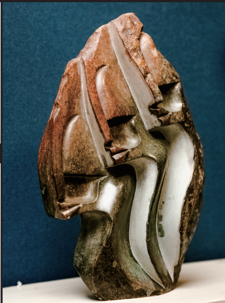
HAPPY PEOPLE / 35*24 / OPAL STONE