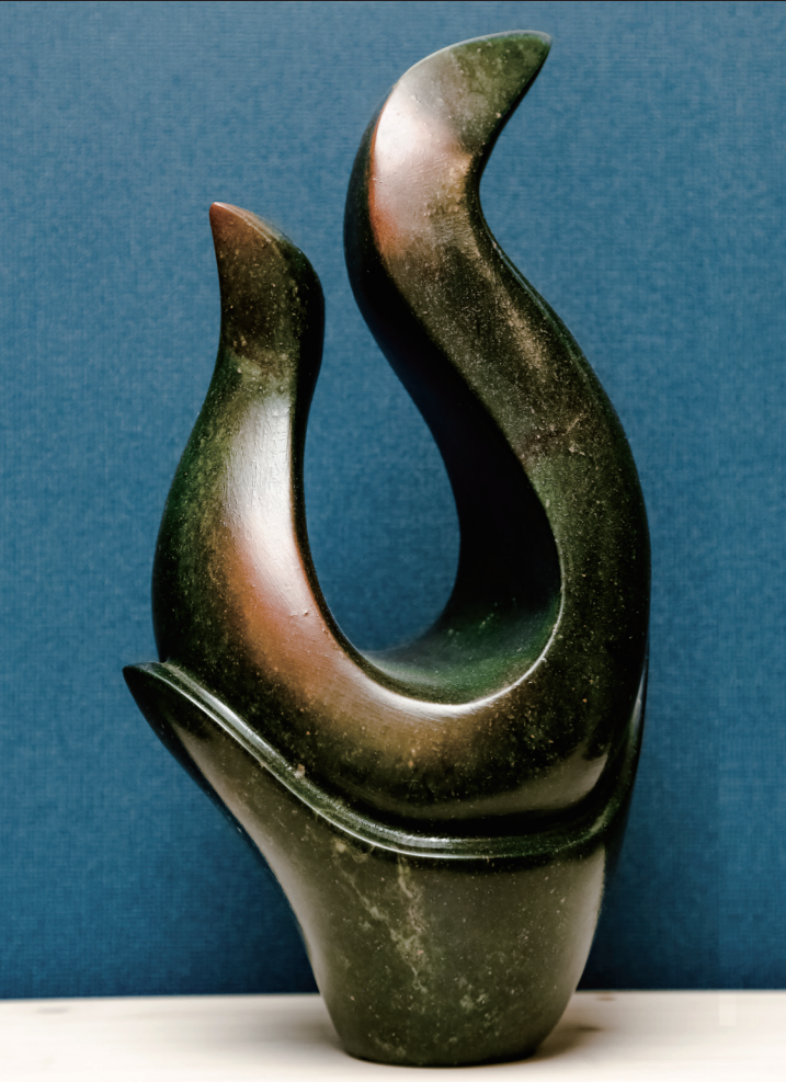
FLOWER FLAME / 36*20 / OPAL STONE