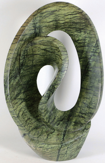
EMBRACE / 55*34 / SERPENTINE