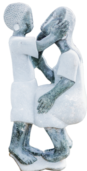
PRECIOUS / 81*33 / OPAL STONE