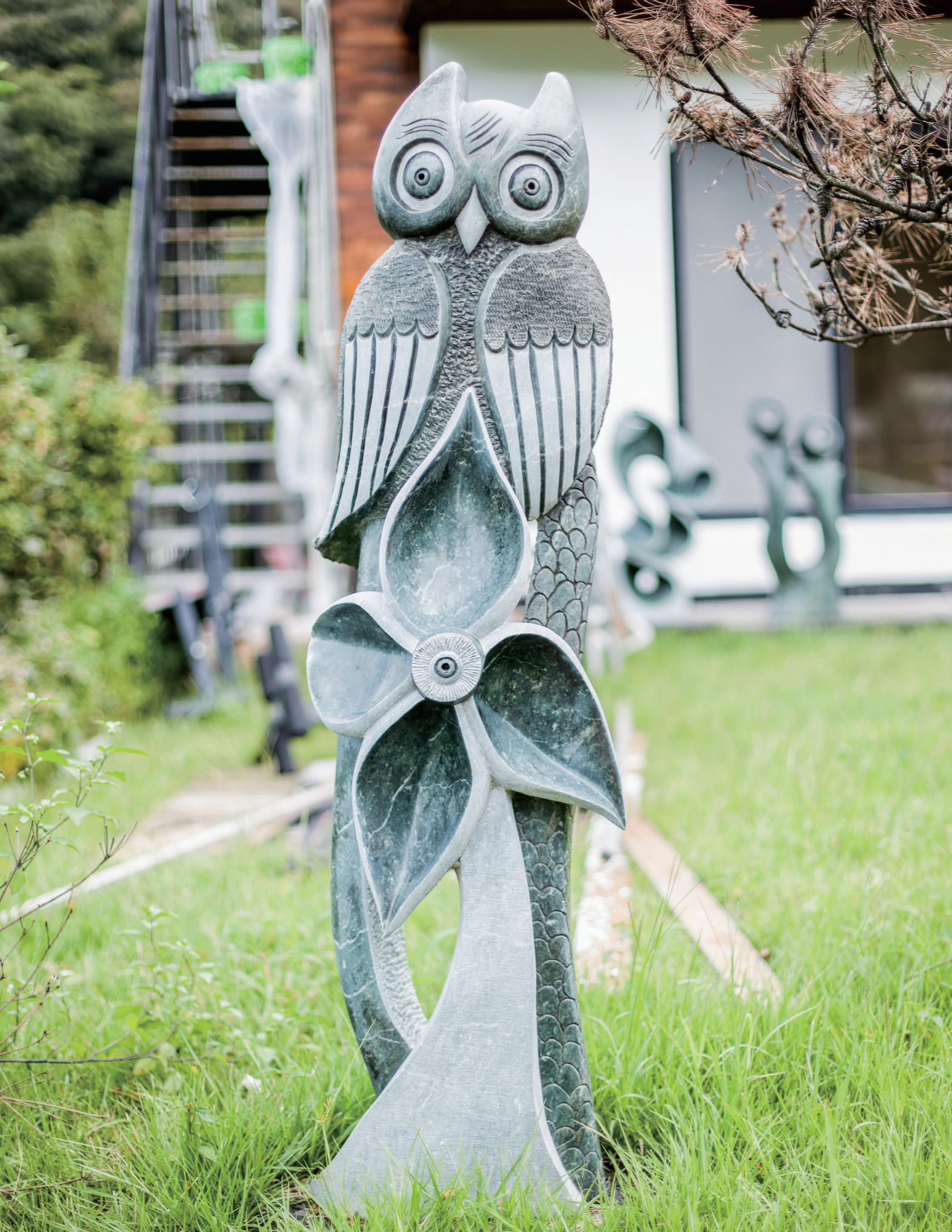
GARDEN WITH A STORY 스토리가 있는 정원 | 대형작품