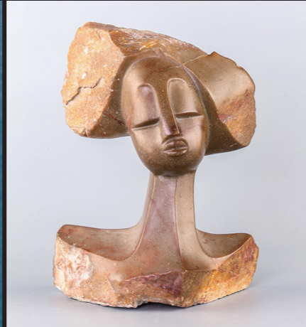
30*23 / WHITE OPAL