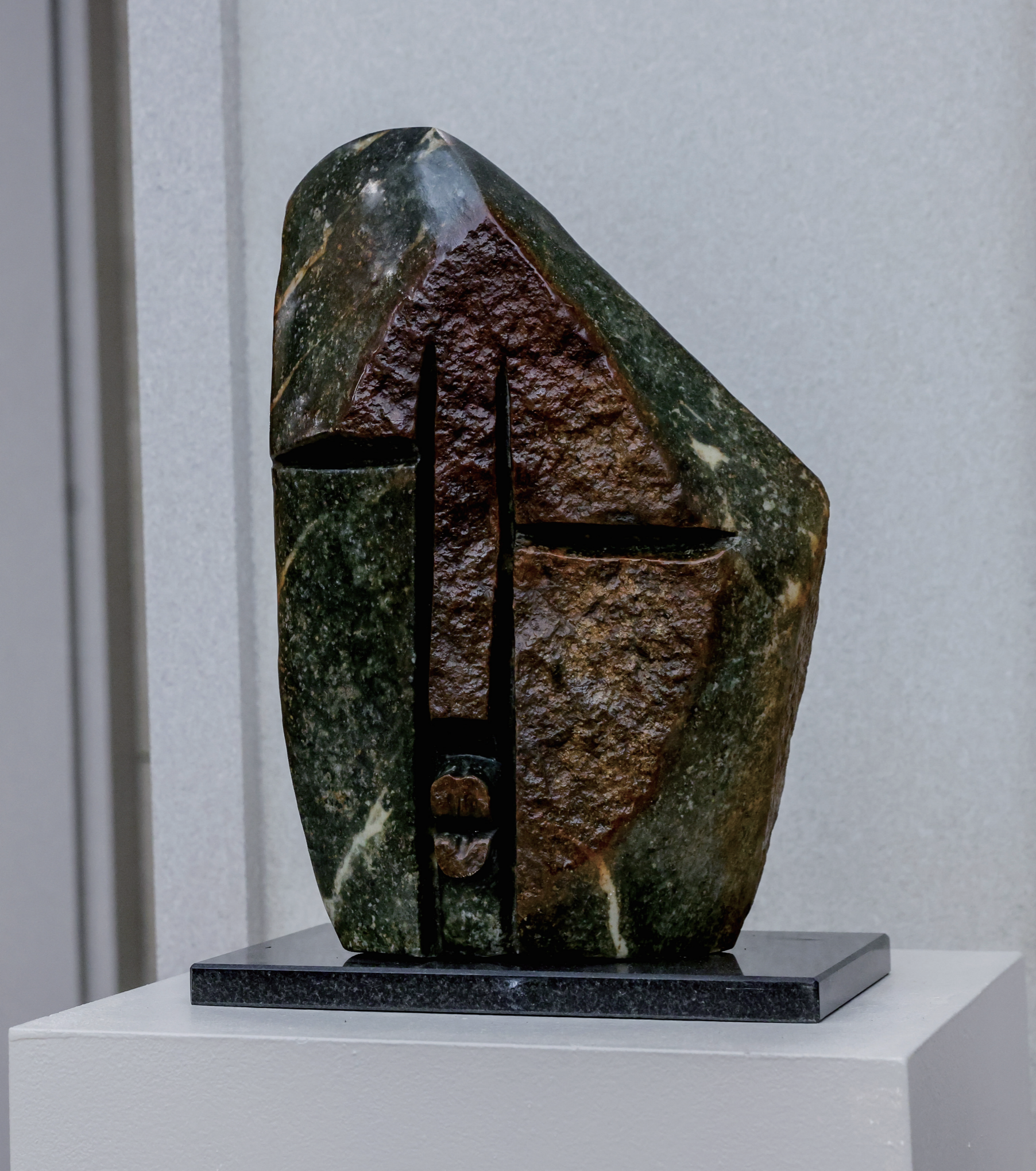
SPECIAL ONE JUST FOR YOU 나만의 갤러리 | 중형작품